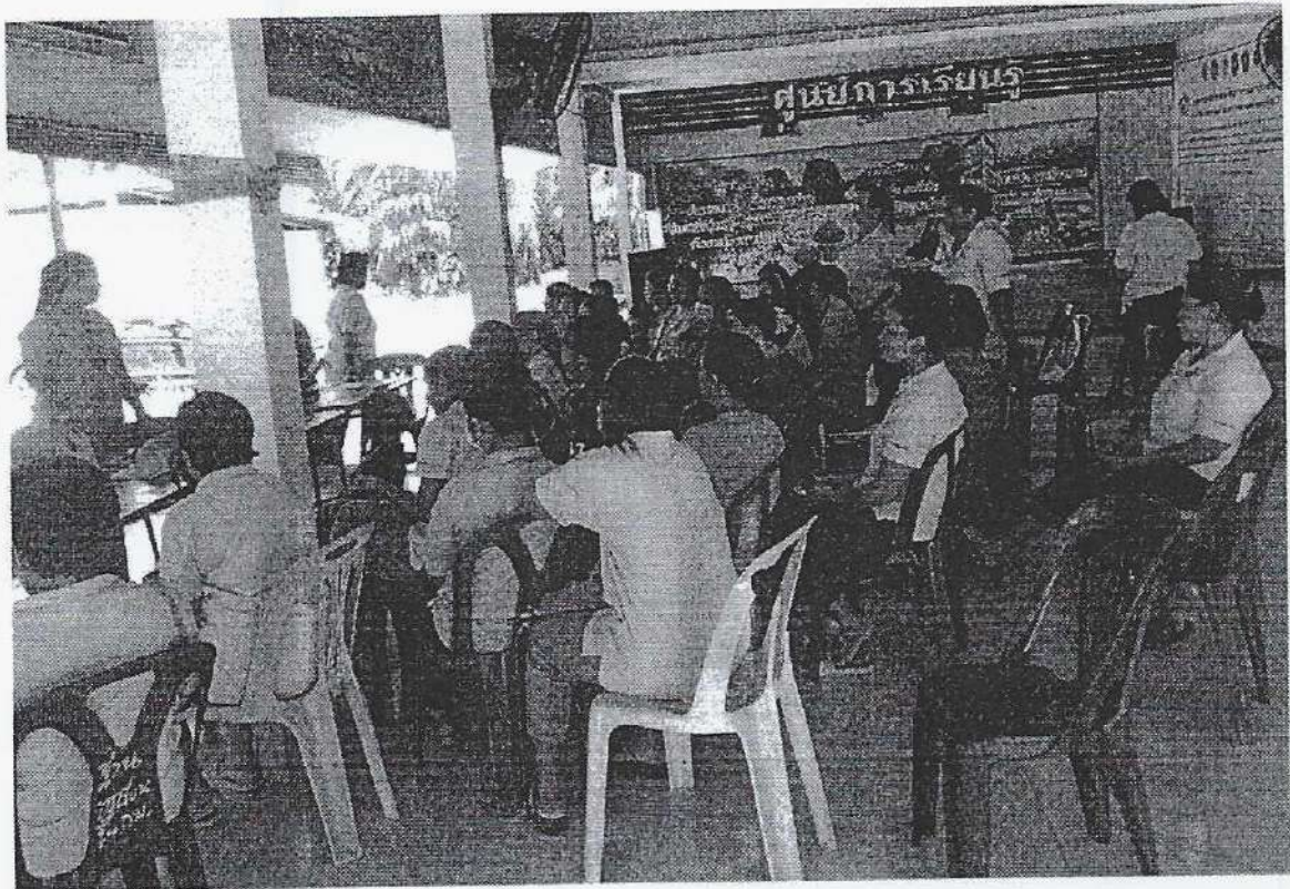
ภาพกิจกรรมโครงการร่วมมือร่วมใจป้องกันภัยโรคติดต่อ ปี 2566